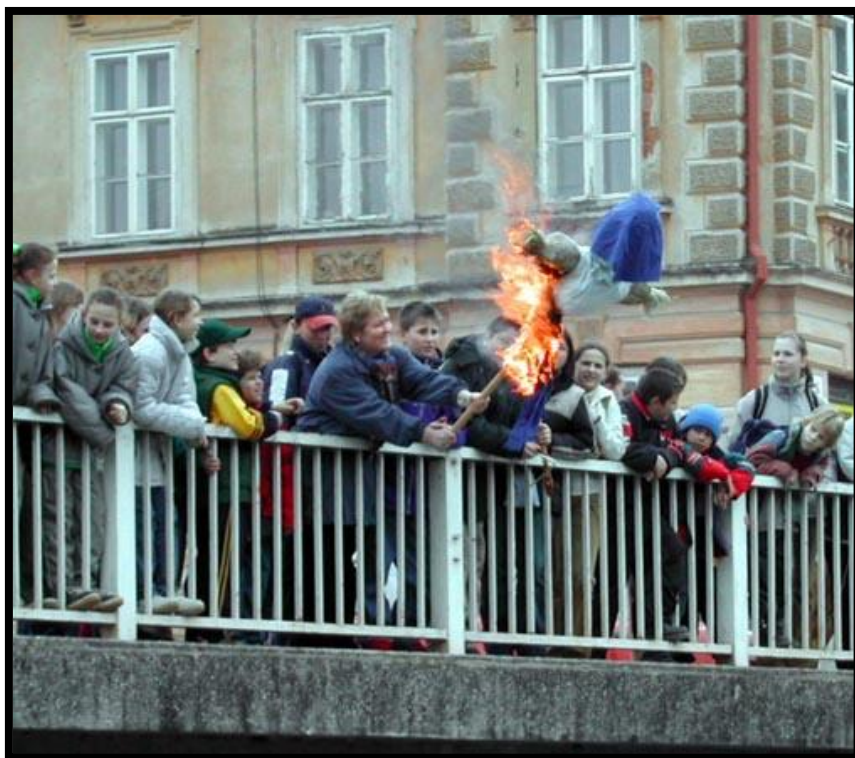
Vítání jara – „Pálení Morany“