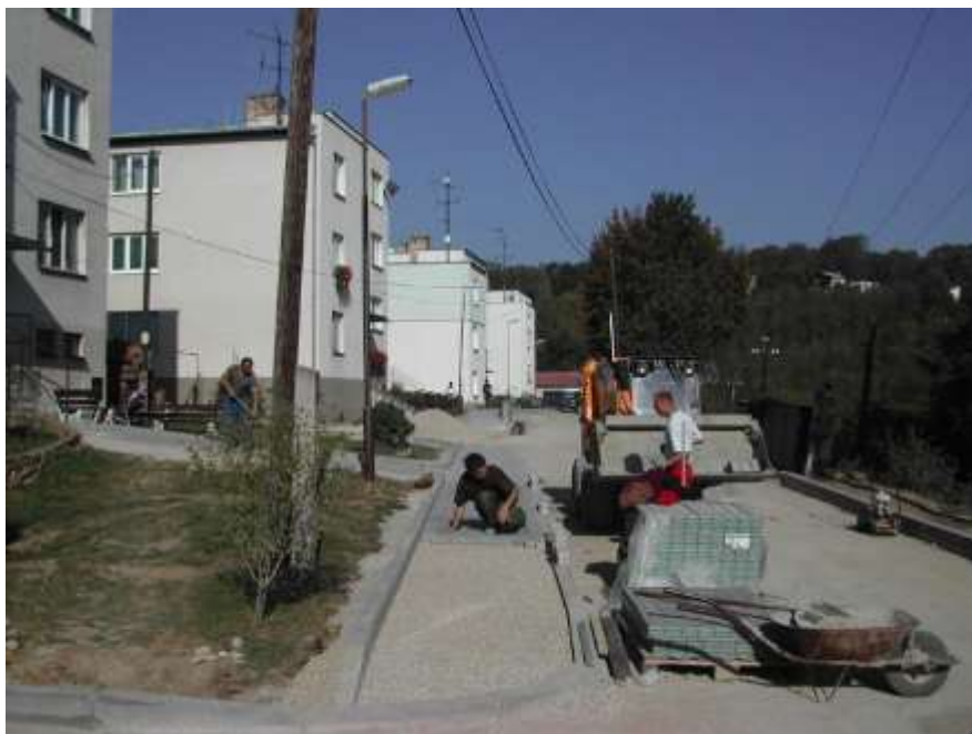
Dokončovací práce v ulici Zátíší