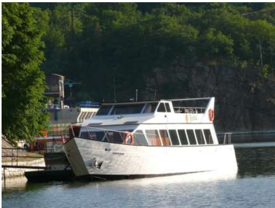
Nový přírůstek na hladině Vranovské přehrady – loď Viktorie