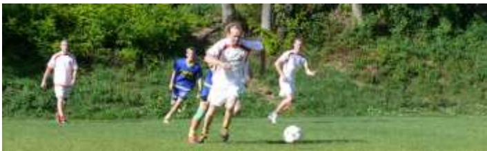
Fotografie z turnaje v malé kopané