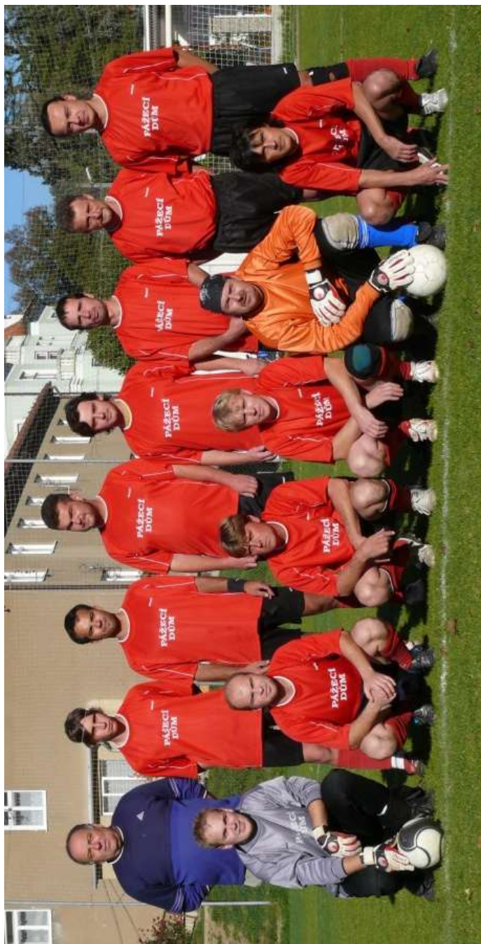
Fotbalisté SKP Vranov nad Dyjí