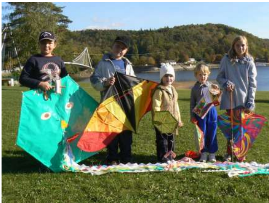
Nejúspěšnější účastníci 10. ročníku Vranovské drakiády