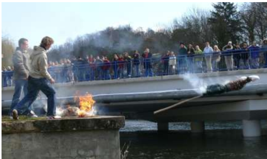
Pálení Morany (26. března 2008)