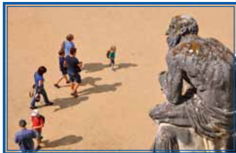
Návštěvníci zámku překonávali abnormálně vysoké teploty.