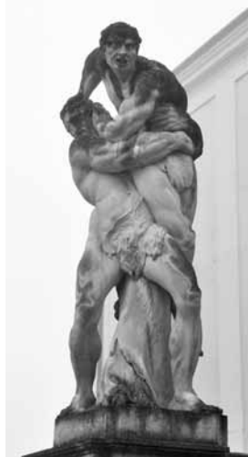
Herkules a Antaius