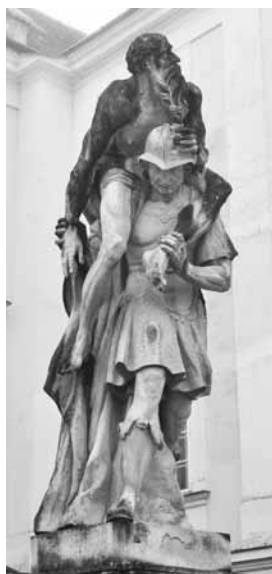
Aeneas a Anchises