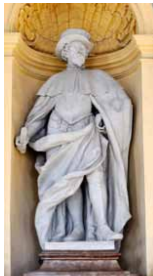
Michael Adolf Althann

Michaela Adolfa I., narozeného roku 1574 v dolnorakouském Murstetten a zemřelého roku 1638 ve Vídni. Roku 1610 byl povýšen do hraběcího stavu. Socha jej představuje oděného v brnění a řádový plášť, s charakteristickým límcem a s manýristickým kloboukem na hlavě. Na levé straně jeho pláště si jen pozorné oko povšimne reliéfu kříže, v jehož křížení břevna je zobrazena Kristova trnová koruna. Císařský generál, velitel pevnosti v uherské Ostřihomi, získal zásluhy pro habsburskou monarchii zejména v obranných válkách proti Turkům a podporováním katolické církve. Sám byl konvertitou, v dětství byl vychován v luteránské konfesi, pod vlivem zvláštního zážitku u kříže na Karlově mostě v Praze ve svých 24 letech přijal katolickou víru. Na paměť svého obrácení ustanovil, aby všichni mužští potomci rodu měli –podle jím zvláště uctívaných světců sv. Michaela a Panny Marie– vždy jedno z křestních jmen Michael, a potomci v ženské linii jméno Marie (není náhodou, že v zámecké kapli jsou těmto světcům zasvěceny oba boční oltáře). Michael Adolf založil roku 1616 jezuitskou kolej v Kremsu na Dunaji a roku 1624 následující v Jihlavě, v Komárně a ve Znojmě, čímž významně podpořil šíření katolické víry a vzdělanosti. Byl též spoluzakladatelem Řádu křesťanského rytířstva Panny Marie a sv. Michaela (roku 1618 v Olomouci), který měl napomáhat čelit turecké invazi a vykupovat křesťany ze zajetí.