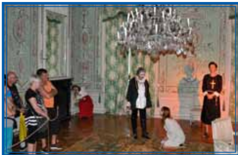
Scéna z divadelní hry „Kráska a netvor“ na zámku