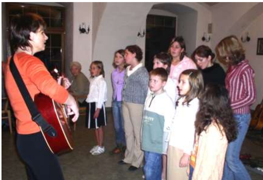
Vystoupení pěveckého kroužku