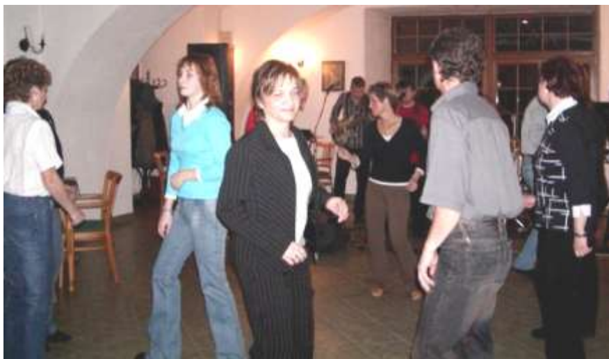
Fotografie z Kateřinské taneční zábavy

Od 20. hodiny pokračovala v Zámeckém hotelu hudební produkce skupiny Free Band Kateřinskou taneční zábavou. Vhodný výběr repertoáru, kontakt s posluchači, profesionalita – těmito slovy hodnotili posluchači vystoupení skupiny, která hrála na taneční zábavě ve Vranově nad Dyjí poprvé a měla velký úspěch. Na tanečním parketu se nejen tančilo, ale i zpívalo do časných ranních hodin.